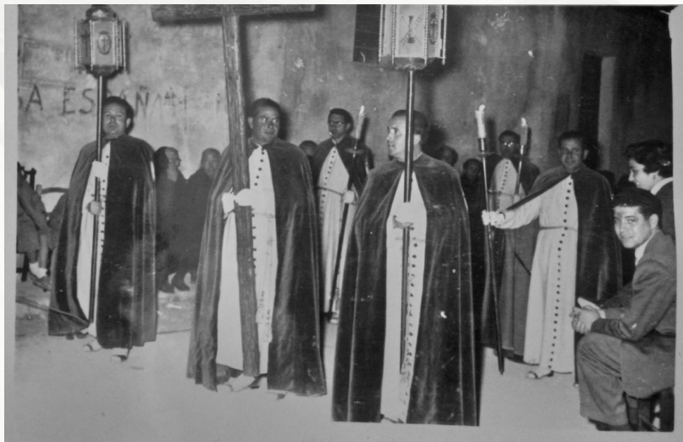
Comitiva de Apertura de la cofradía. 8 abril 1955.