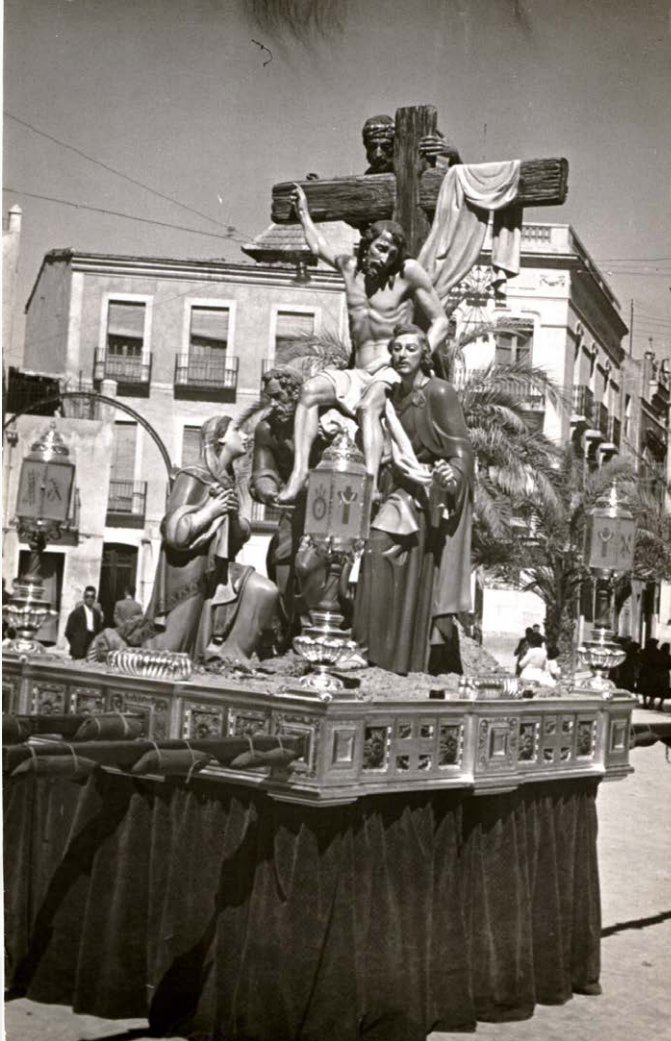
El paso cuando empezó el traslado